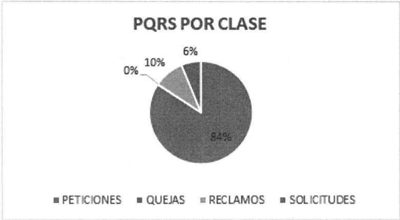
Gráfica clase de PQRS recibidas durante el primer trimestre 2025.

Del total de las PQRS, recibidas en el primer trimestre de 2025, se observó que las solicitudes interpuestas por los ciudadanos bajo el tipo de PETICIONES representaron el 84%, de participación; se puede inferir que el número de las mismas han aumentado teniendo en cuenta que corresponden a las solicitudes de los clientes externos para la realización de eventos y publicidad de nuestros productos. El porcentaje del 10% en reclamos, corresponde a las solicitudes de los clientes externos relacionada con la calidad y presentación de nuestros productos. Con estos resultados en las PQRS, la ciudadanía muestra una confianza inicial en el sistema.